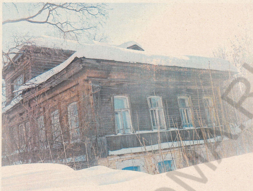
Фото 3 Фрагмент бокового (южного) фасада