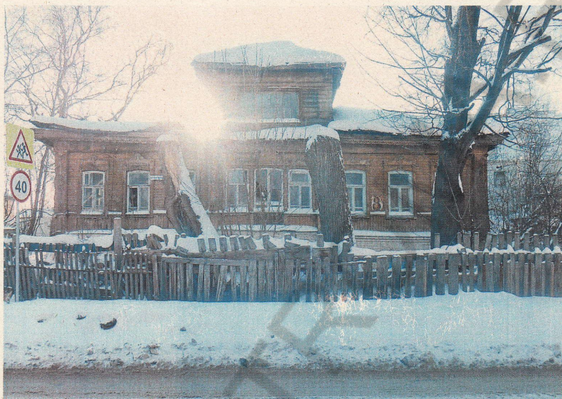
Фото 1. Фрагмент главного (западного) фасада

Приложение №1 к охранному обязательству собственника или иного законного владельца объекта культурного наследия регионального значения, включенного в единый государственный реестр объектов культурного наследия (памятников истории и культуры) народов Российской Федерации, утверждённому приказом Охранкультуры Костромской области от « 04 » апреля 2024 № 38