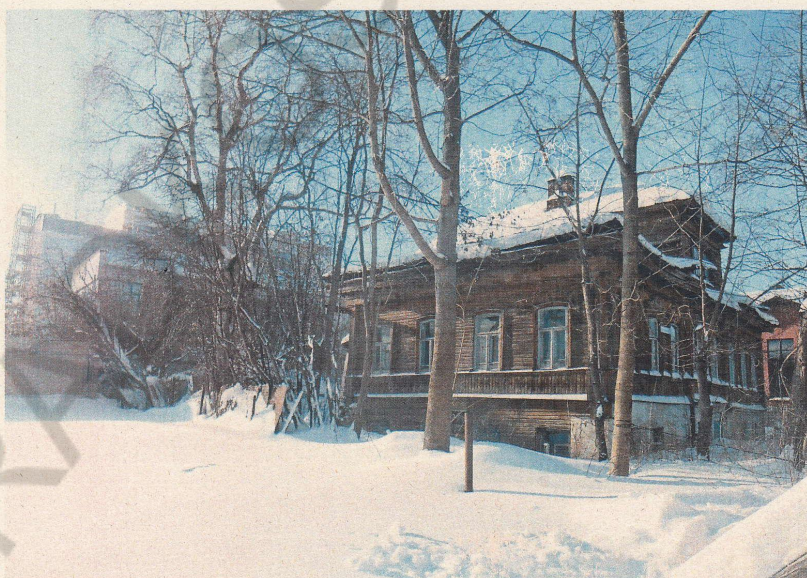
Фото 2. Фрагмент бокового (северного) и главного (западного) фасадов