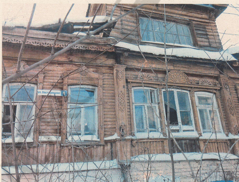
Фото 4 Фрагмент внутреннего помещения