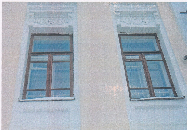
Фото 6. Фрагмент оконных проемов с декоративными элементами