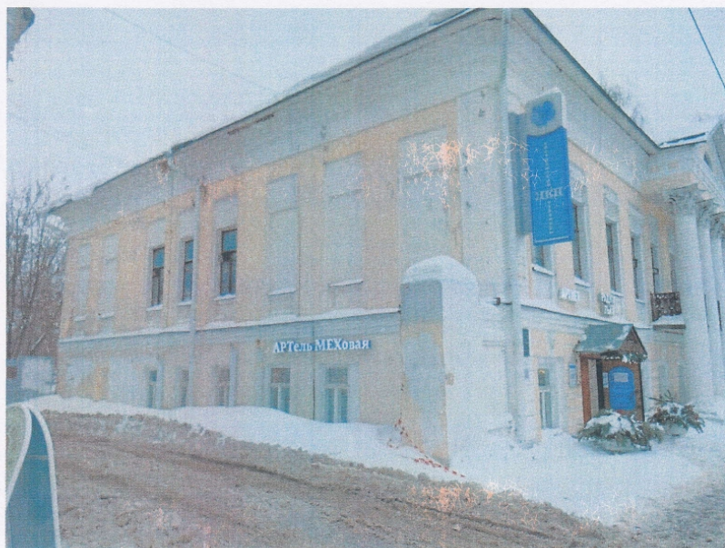
Фото 3. Вид со стороны бокового (северного) фасада