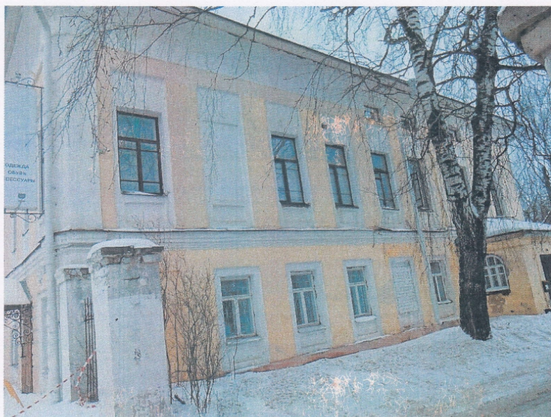
Фото 4. Вид со стороны бокового (южного) фасада