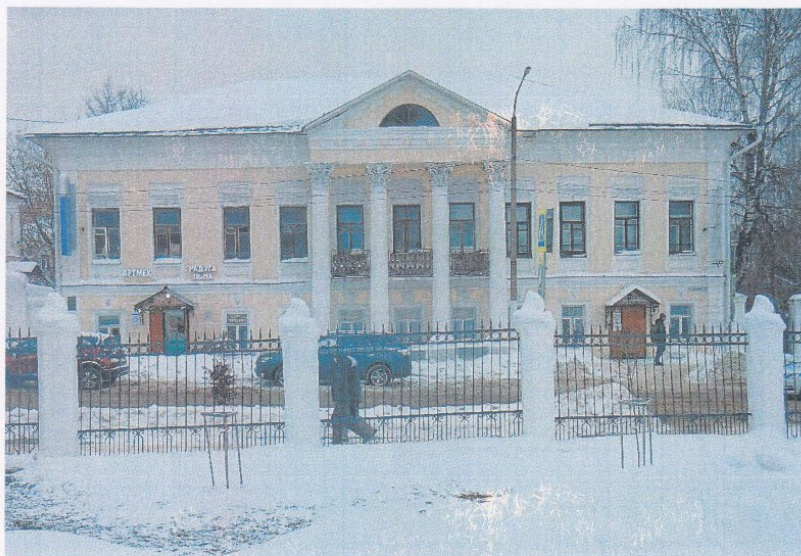
Фото 2. Вид со стороны главного (восточного) фасада