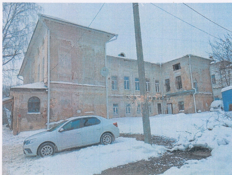
Фото 5. Вид со стороны дворового (западного) фасада