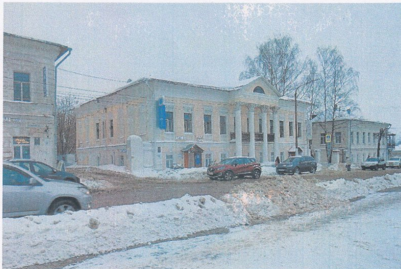
Фото 1. Общий вид со стороны улицы Чайковского

Приложение №1 к охранному обязательству собственника или иного законного владельца объекта культурного наследия регионального значения, включенного в единый государственный реестр объектов культурного наследия (памятников истории и культуры) народов Российской Федерации, утверждённому приказом Охранкультуры Костромской области от « 26 » 03 2023 № 33