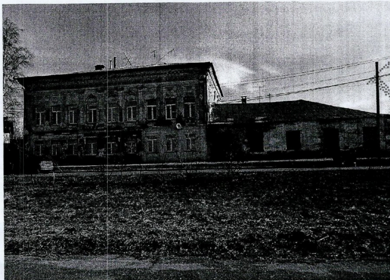
Фото 1. Вид со стороны главного (юго-западного) фасада

Приложение №1 к охранному обязательству собственника или иного законного владельца объекта культурного наследия регионального значения, включенного в единый государственный реестр объектов культурного наследия (памятников истории и культуры) народов Российской Федерации, утверждённому приказом Охранкультуры Костромской области от «14» апреля 2020 № 51