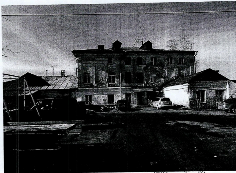
Фото 3. Вид со стороны дворового (северо-восточного) фасада