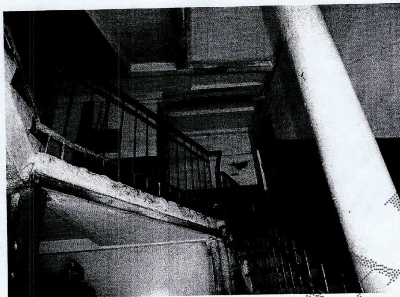
Фрагмент внутреннего помещения общего пользования (лестница)