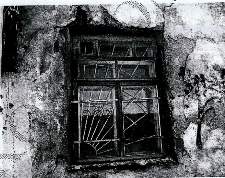
Фрагмент оконного заполнения