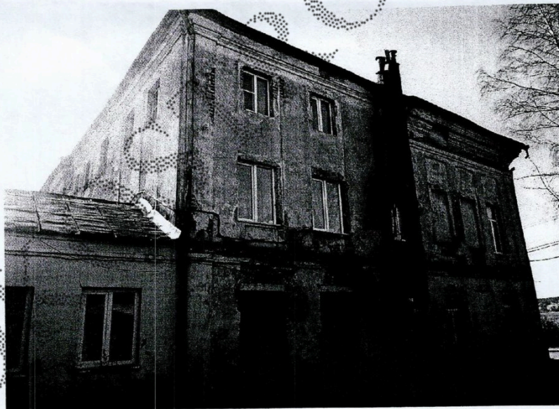
Фото 4. Вид со стороны бокового (северо-западного) фасада