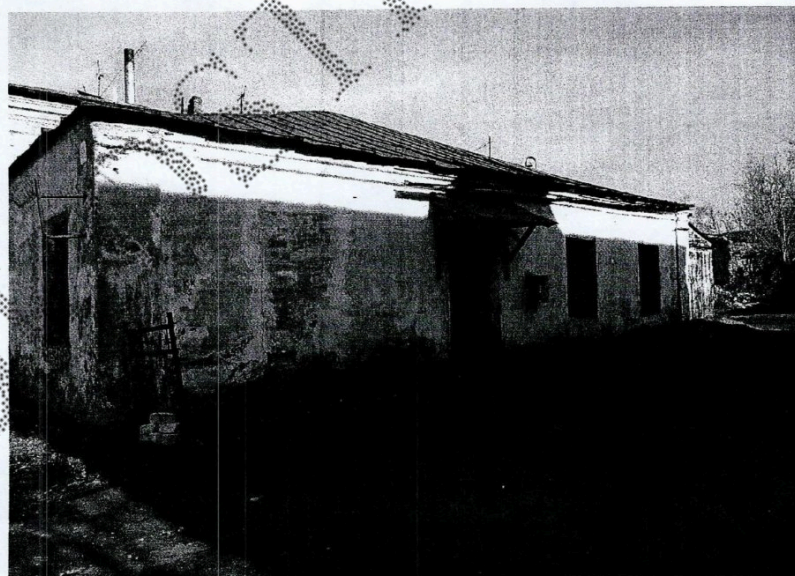
Фото 2. Вид со стороны бокового (юго-восточного) фасада