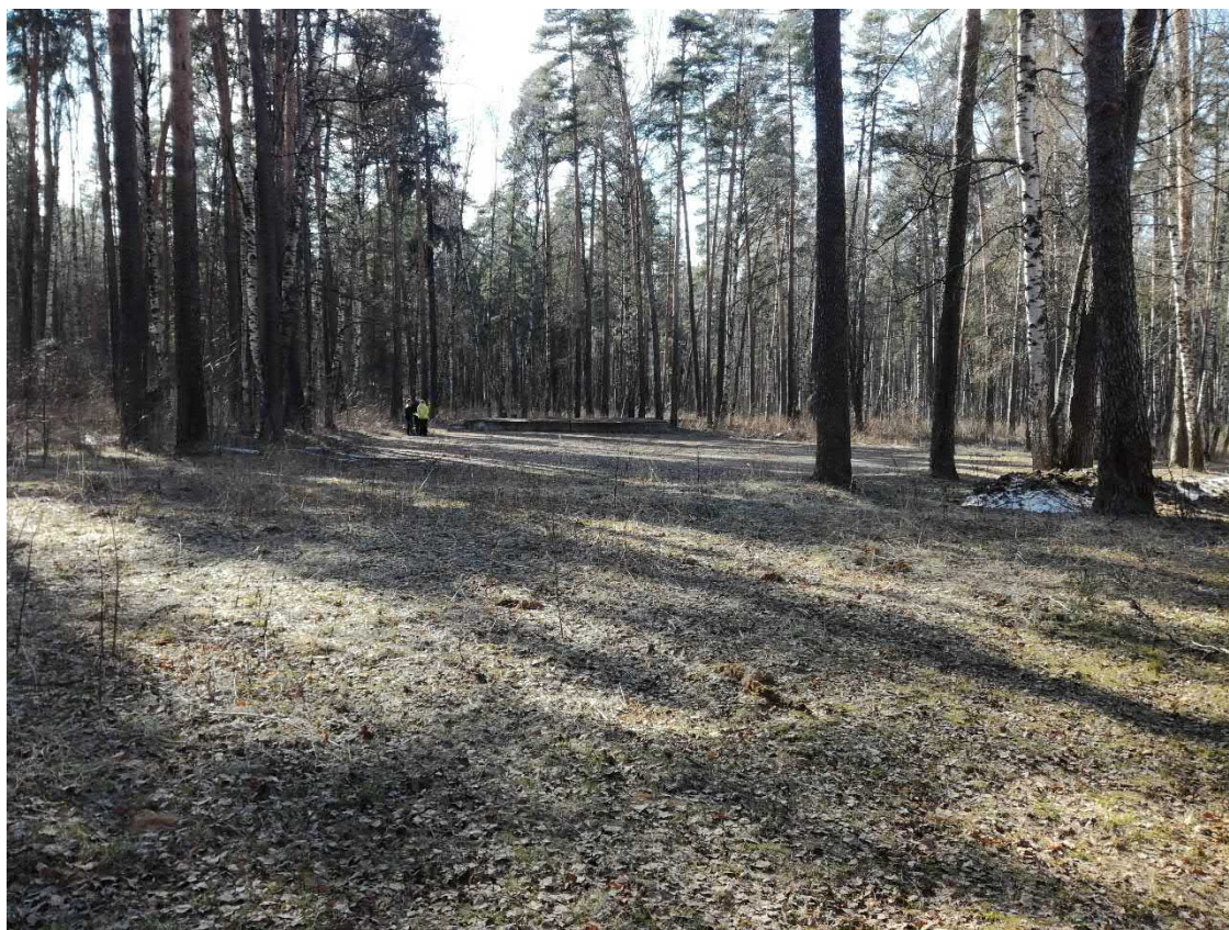
Фото 1. Общий вид на площадку и сцену со стороны прудов

Площадка имеет прямоугольную форму, её площадь составляет 804 кв. м. Общая площадь места проведения работ составляет около 929,3 кв.м.