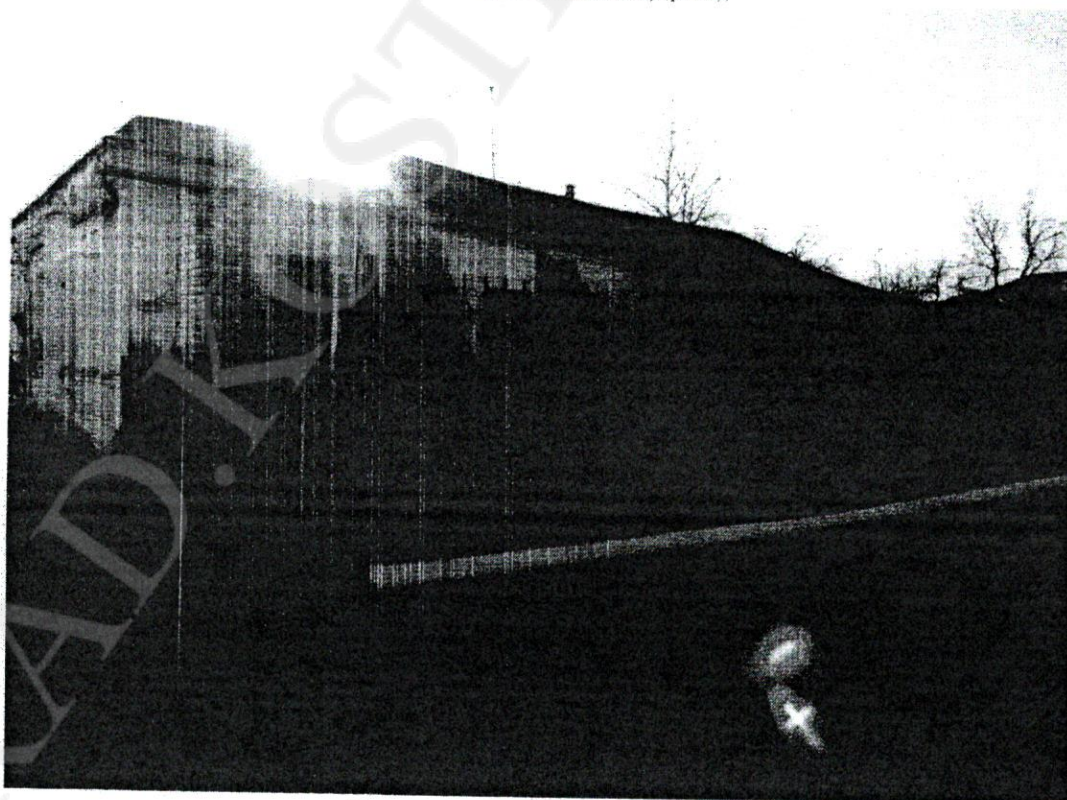
Дом жилой Акатова, 1-я пол. XIX в.» г. Кострома, ул. Комсомольская. 31 Боковой (северо-восточный) фасад