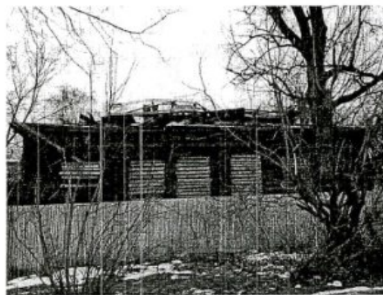
Фото 4. Боковой юго-западный фасад