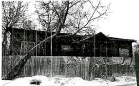
Фото 2. Боковой (северо-восточный) фасад