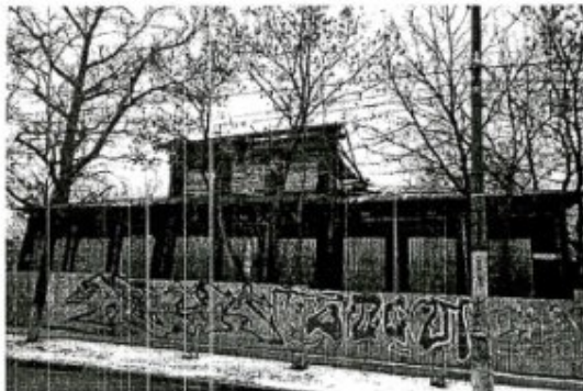
Фото 1. Вид со стороны главного (юго-восточного) фасада

Фотографическое изображение объекта культурного наследия